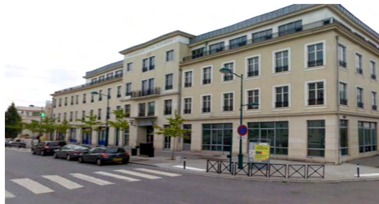
IFIS/Bâtiment ERASME 6-8, cours du Danube 77700 Serris

En cas de problème / In case of trouble :